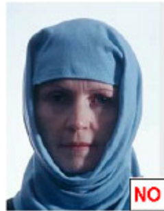
Parte del volto coperto - ombre sul volto